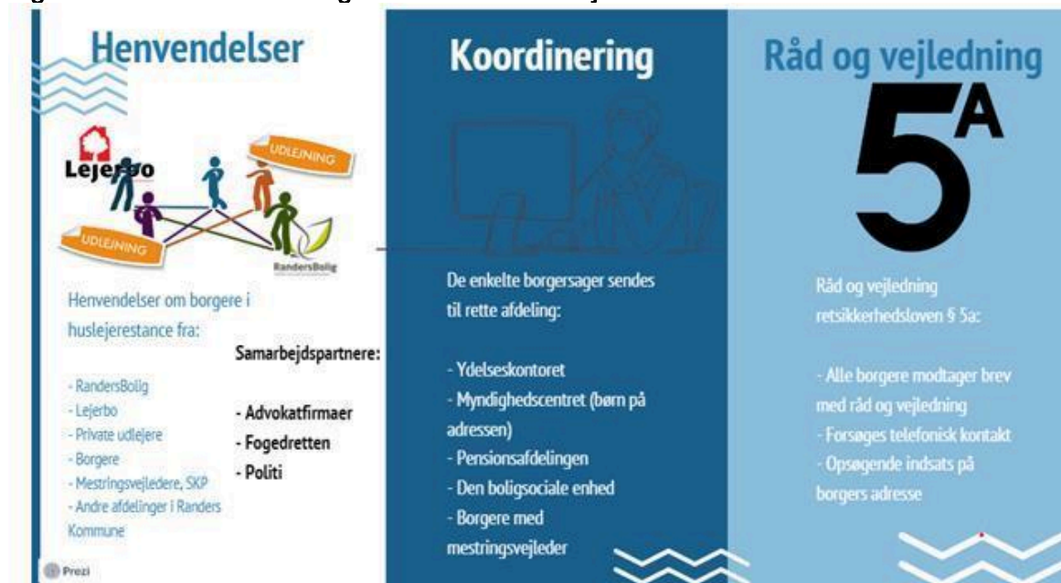
Figur 1: Praksis for Den Boligsociale Enheds arbejde

Uanset hvilken afdeling sagen viderefremmes til, sikrer Den Boligsociale Enhed, at der følges op på henvendelsen, ligesom enheden kan være behjælpelig med opsøgende indsats, såfremt afdelingen ikke kan opnå kontakt med borgeren.