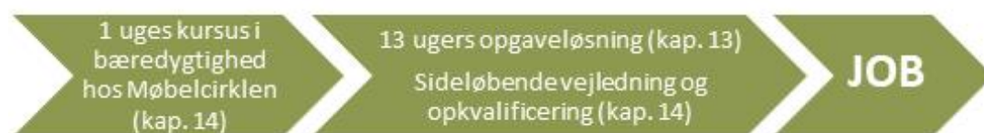
Figur 1. Overblik over "Videre i job"-forløbet

De arbejdsopgaver, som borgerne i "Videre i job" skal varetage, må ikke være arbejdsopgaver, arbejdspladsen har budgetteret med. Det vil sige, at arbejdsopgaverne er opgaver, der ellers ikke ville være blevet udført. Dette skal ses i forhold til, at projektet ikke må fortrænge ordinært ansatte eller virke konkurrenceforvridende. Opgaveløsningen kan som udgangspunkt derfor ikke foregå på opgaveområder, der tidligere har været udført som ordinært arbejde.